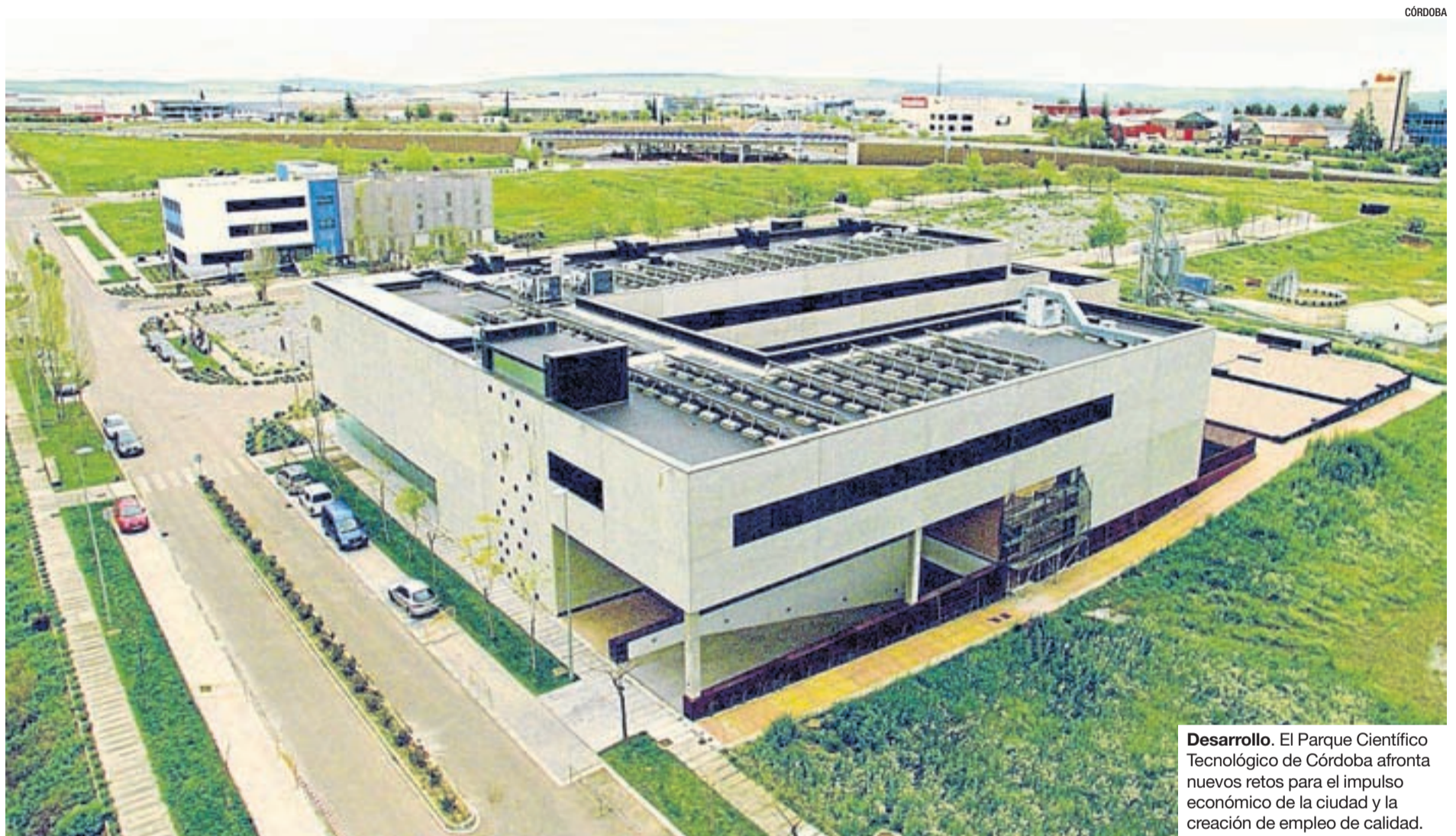
Desarrollo. El Parque Científico Tecnológico de Córdoba afronta nuevos retos para el impulso económico de la ciudad y la creación de empleo de calidad.

◆ Diversas empresas internacionales muestran interés en su implantación