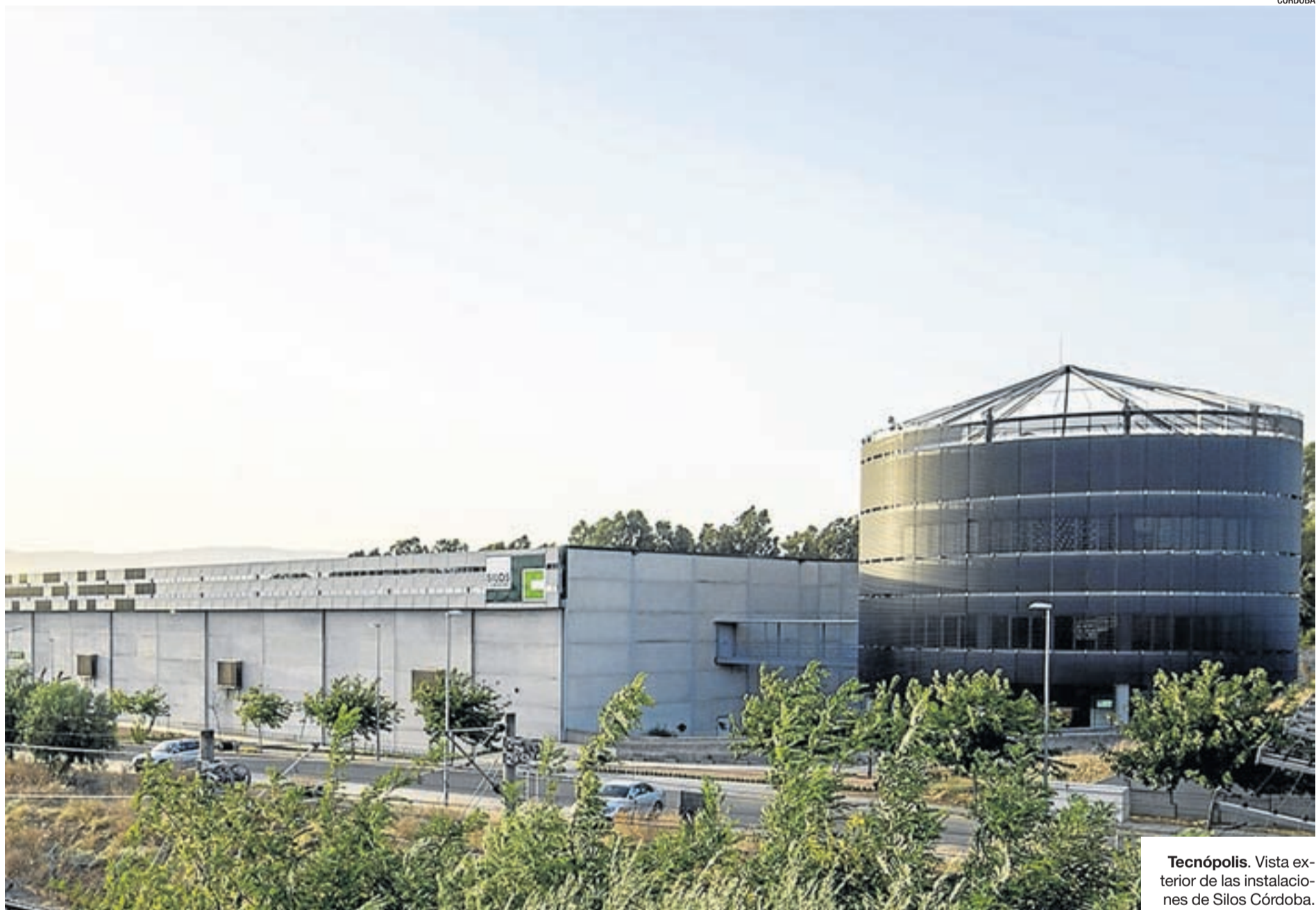
Tecnópolis. Vista exterior de las instalaciones de Silos Córdoba.